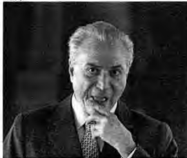
O texto será enviado pelo presidente Michel Temer nesta segunda-feira