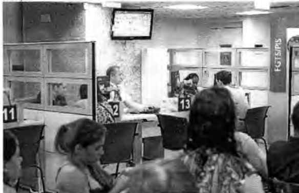
De acordo com a legislação, a remuneração básica das contas do FGTS é de 3% ao ano, além da variação da TR

sendo o patrimônio deprecitado. De 2010 a 2015, a perda ficou em mais de 18%, segundo dados do Ministério do Planejamento. Agora, com a inflação mais baixa e a distribuição dos lucros, os trabalhadores tendem a ganhar um pouco mais.